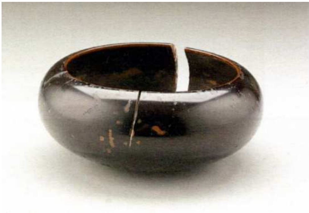
良寛の托鉢とされる